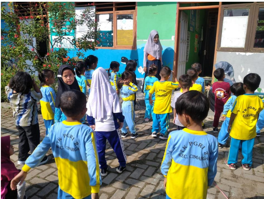
Gambar 3.4 : TK PGRI 2