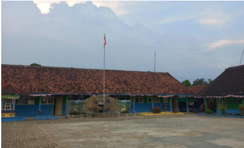
Gambar 3.5 : SDN 1 Mekarjaya