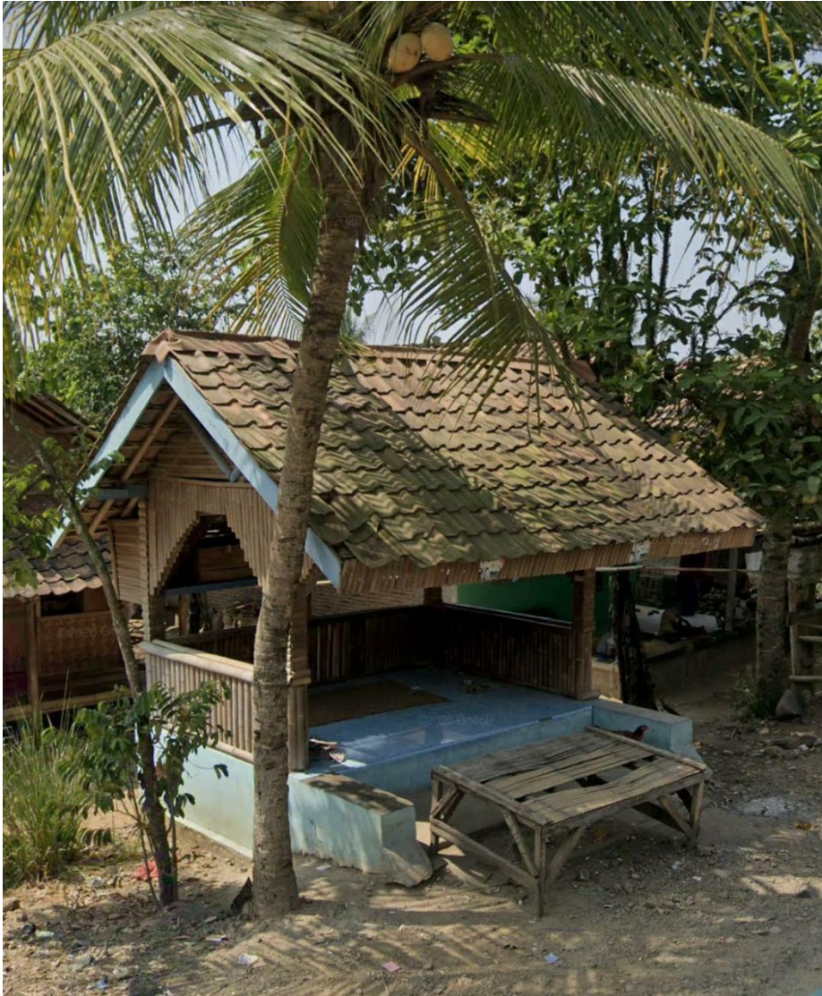
Gambar 3. 8 : Pos Ronda