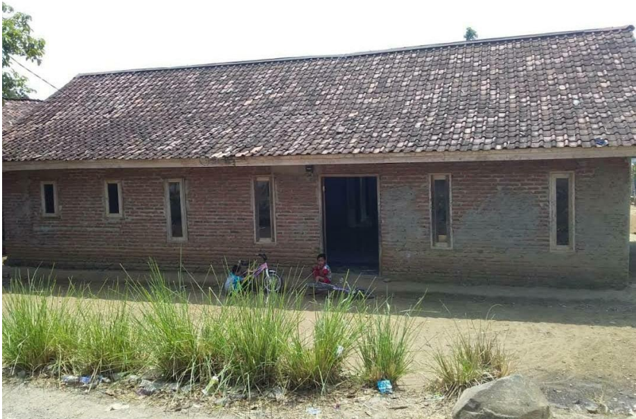
Gambar 3.7 : TPA Raudhafatul Huffaz