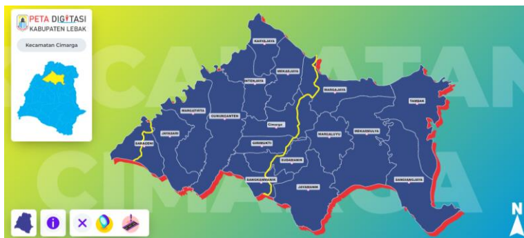
Gambar 3.1: Lokasi KKN-Reguler Kelompok 176

https://simpedal.lebakkab.go.id/kecamatan/cimarga