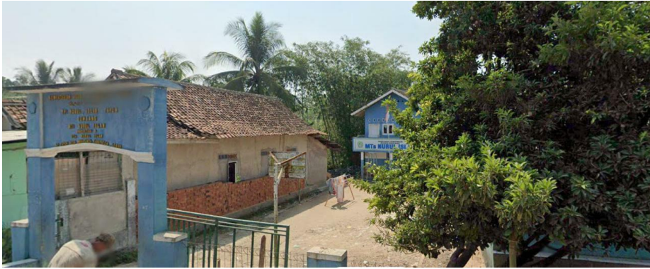
Gambar 3.6 : MTs Nurul Islam