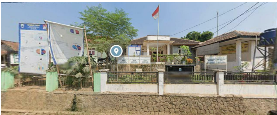
Gambar 3. 2 : Kantor Pemerintahan Desa Mekarjaya

https://maps.app.goo.gl/FFZPMMgvSmoRjMrKA