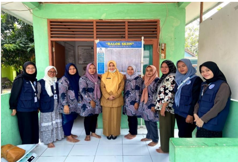
Lampiran 6.22 Sosialisasi Kegiatan Lemo Clean