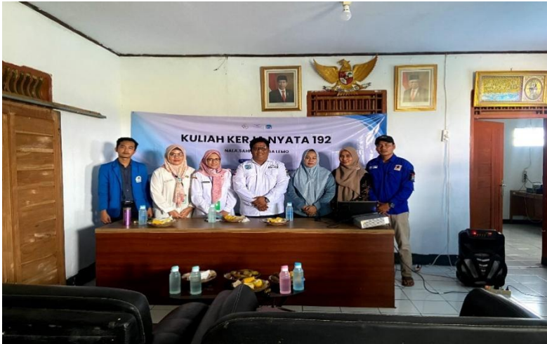
Lampiran 6. 23 Kegiatan Lemo Clean