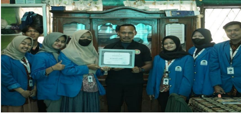
Lampiran 6. 25 Liburan