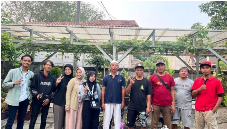
Lampiran 6.21 Membantu Kegiatan Posyandu Siantan 2