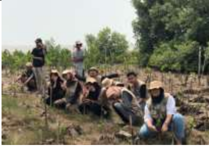
Gambar 47 Penanaman Mangrove