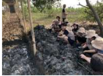
Gambar 6 Penyemaian Mangrove