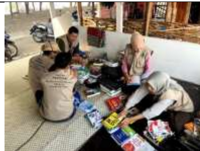
Gambar 14 Pendataan Bibliografi Buku di Rumah Pintar