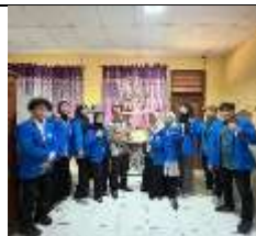
Gambar 40 Pemberian Cendramata Kepada Pihak SDN Kramat 1