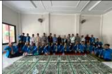
Gambar 36 Sosialisasi Penguatan Lembaga Dakwah