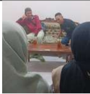
Gambar 18 Pertemuan bersama kepala BPD Desa Sukawali