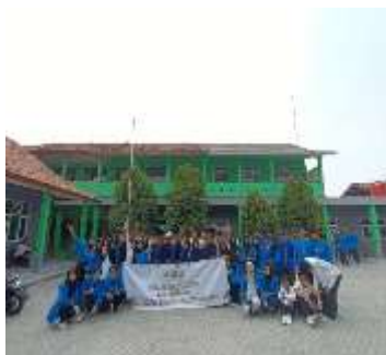
Gambar 41 Perpisahan bersama siswa-siswi SMP Perintis dan SMA Yustika