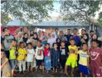
Gambar 21 Kegiatan Bimbel di Rumah Pintar