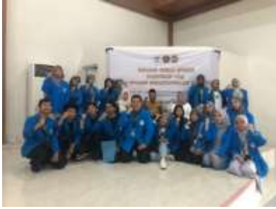
Gambar 5 Pembukaan KKN 164