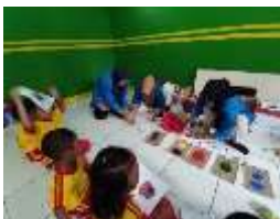
Gambar 25 Sukawali Mengajar