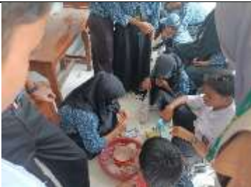
Gambar 49 Praktikum Pembuatan Es Krim di SMA Yustika