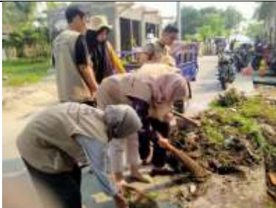
Gambar 11 Kegiatan Kerja Bakti