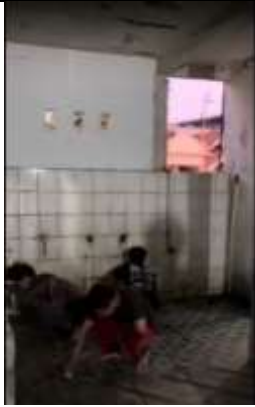
Gambar 7 Bersih-Bersih Mushollah Depan Posko