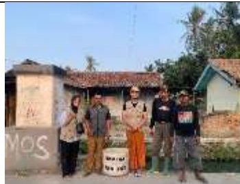
Gambar 50 Pengadaan Bak Sampah