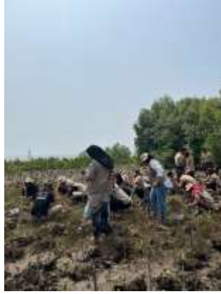
Gambar 46 Penanaman Mangrove