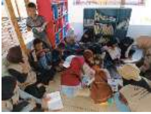
Gambar 33 Kegiatan Bimbel di Rumah Pintar