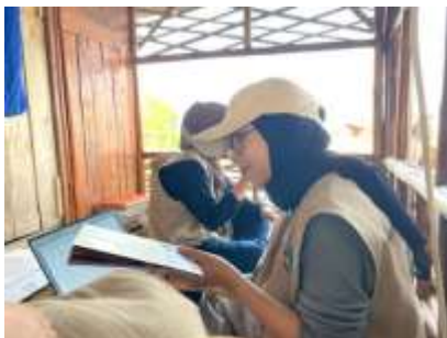
Gambar 13 Pendataan Bibliografi Buku di Rumah Pintar