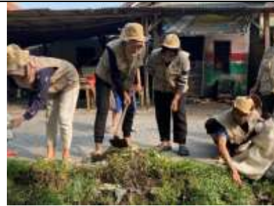
Gambar 12 Kegiatan Kerja Bakti