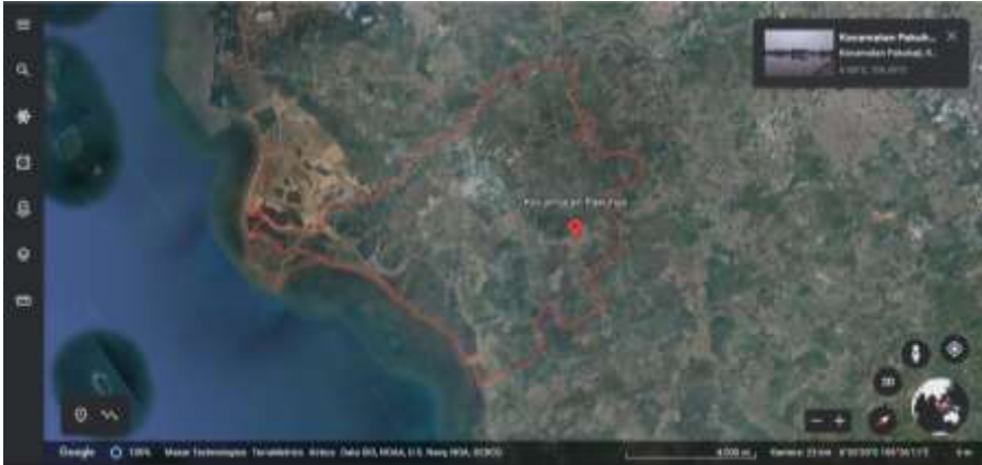
Gambar 4. Pemetaan Program Kerja KKN 164: Sukawali Pintar dan Sukawali Mengaji di Wilayah Kecamatan Paku Haji (Google Earth, 2023)

Wilayah KKN 164, bertempat di Desa Sukawali, Kecamatan Paku Haji, Kabupaten Tangerang. Provinsi Banten. Indonesia.