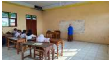
Gambar 30 Sukawali Mengajar