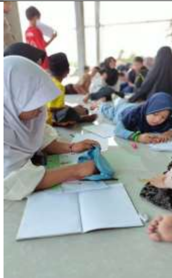
Gambar 24 Kegiatan Bimbel