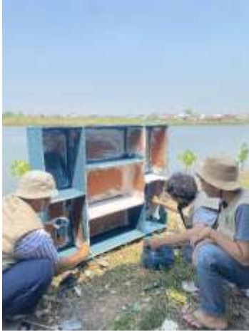
Gambar 9 Pembuatan Rak Buku Rumah Pintar