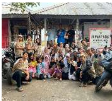
Gambar 43 Pembukaan Kembali Rumah Pintar