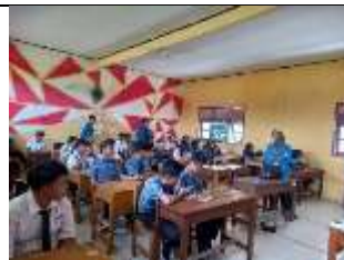
Gambar 20 Sukawali Mengajar