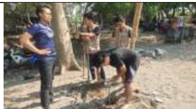
Gambar 32 Kegiatan Pemasangan Net Volly