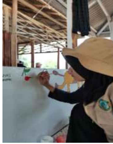
Gambar 10 Menghias Rumah Pintar