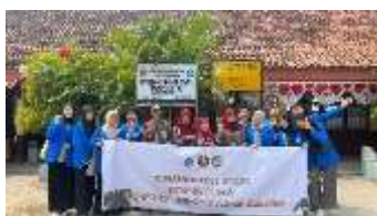
Gambar 39 Perpisahan dengan Pihak SDN Kramat 1