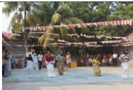
Gambar 38 Kegiatan 17an Agustus