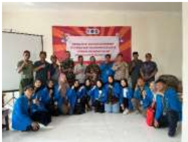
Gambar 35 Sosialisasi Penguatan Keuangan Keluarga