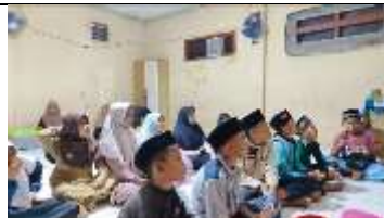
Gambar 26 Sukawali Mengaji