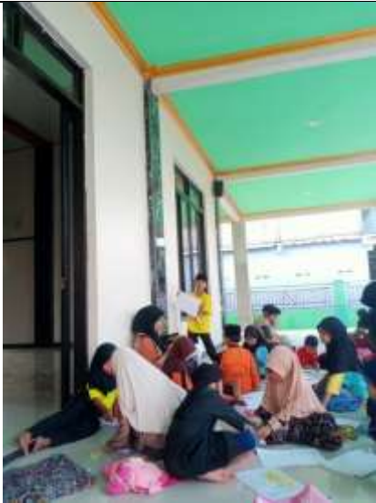
Gambar 23 Kegiatan Bimbel