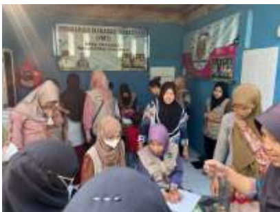
Gambar 37 Kegiatan Posyandu