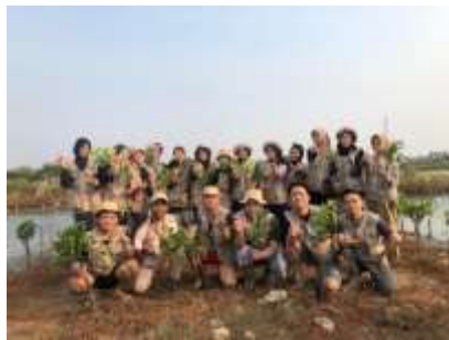
Gambar 17 Penanaman Mangrove