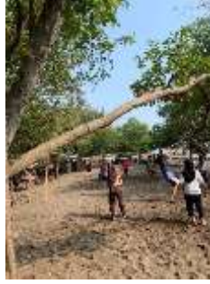
Gambar 22 Bermain Volly bersama warga sekitar Pantai KSS