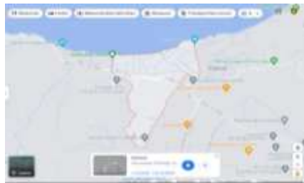
Gambar 2. Sebaran Wilayah Pelaksanaan KKN 164 Partisan