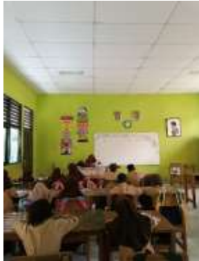
Gambar 27 Sukawali Mengajar