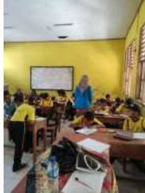
Gambar 28 Sukawali Mengajar