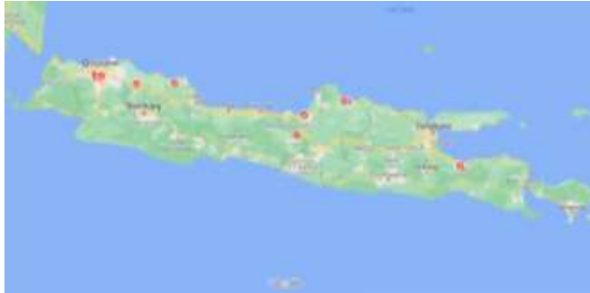
Gambar 1. Sebaran Wilayah Pelaksanaan KKN 164 Partisan

yang biasa untuk dijual lagi ke berbagai daerah sekitar. Di masa modern dan banyaknya globalisasi, masyarakat Desa Sukawali masih mempertahankan adat budayanya, yakni pesta laut di akhir tahun, agar nelayan mendapatkan tangkapan ikan yang banyak.