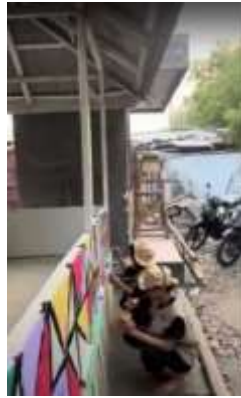
Gambar 8 Menghias Rumah Pintar