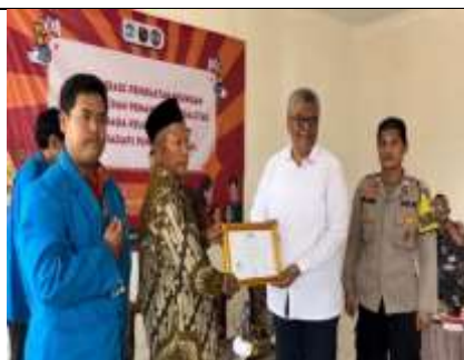
Gambar 44 Penyerahan Cendramata Kepada Narasumber Kegiatan Sosialisasi Penguatan Keuangan Keluarga