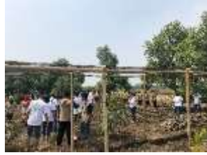
Gambar 34 Peringatan Hari Konservasi Nasional