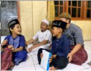
Gambar 16 Kegiatan mengajar mengaji di TPA