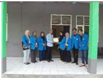
Gambar 42 Pemberian Cendramata Kepada Ketua Yayasan SMP Perintis dan SMA Yustika