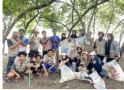
Gambar 48 Bersih-bersih Pantai KSS