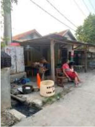
Gambar 45 Pengadaan Bak Sampah