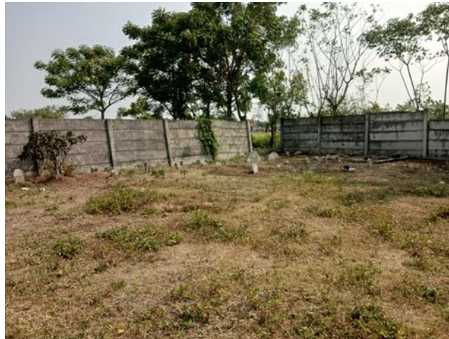
Gambar 3.12 Tempat Pemakaman Umum Desa Tanjakan