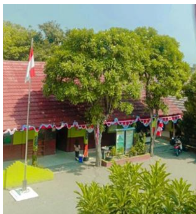
Gambar 3.7 SDN I Tanjakan