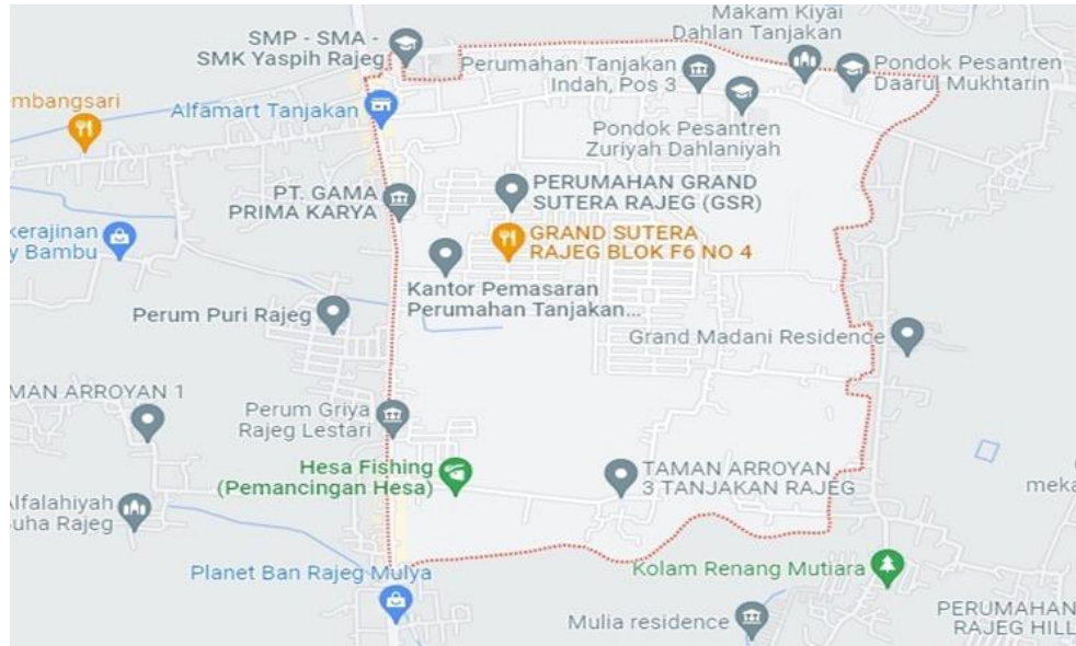
Gambar 3.1 Letak Geografis Desa Tanjakan