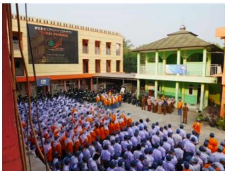
Gambar 3.8 SMK Tunas Pemuda