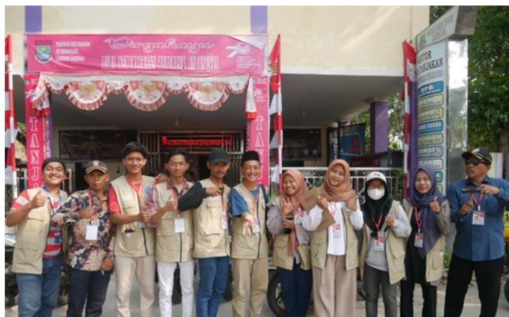
Gambar 3.4 Kantor Desa Tanjakan

Sarana dan Prasarana milik pemerintah yang ada di Desa Tanjakan berupa kantor desa yang bersifat semi permanen. Kantor desa terletak tidak jauh dari jalan masuk ke Desa Tanjakan itu sendiri. Kantor desa memiliki dua lantai. di lantai pertama digunakan untuk administrasi desa, penerimaan tamu, perpustakaan desa, dan kamar mandi. sedangkan di lantai dua terdapat aula yang digunakan untuk acara seminar, penyuluhan dan pertemuan antar warga desa dengan aparat desa. Keadaan di kantor desa sudah cukup baik, saat ini kantor di desa di lantai satu masih dalam tahap renovasi dan di lantai dua tahap renovasi sudah selesai dilakukan hanya perlu dibersihkan dan dirapikan (menata kembali barang-barang sesuai tempatnya).