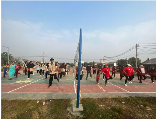
Gambar 3.11 Lapangan Olahraga Desa Tanjakan