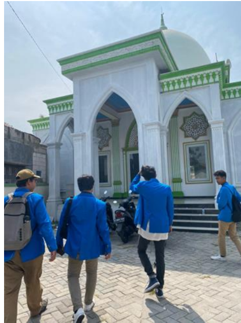
Gambar 3.10 Masjid Al-Hidayah Desa Tanjakan

Warga Desa Tanjakan yang seluruhnya beragama Islam, membuat tradisi keislaman di desa tersebut sangat kuat dengan adanya pondok pesantren, 6 buah masjid dan beberapa musholla yang dijadikan tempat beribadah, juga dijadikan tempat pengajian rutin, majelis ta'lim, dan sebagai tempat untuk memperingati kegiatan hari-hari besar islam.