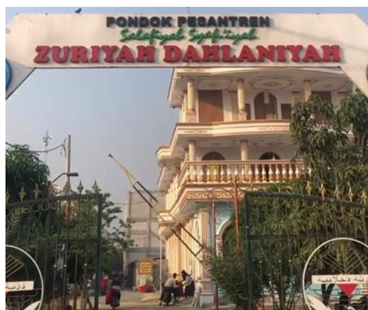
Gambar 3.9 Pondok Pesantren Zuriyah Dahlaniyah