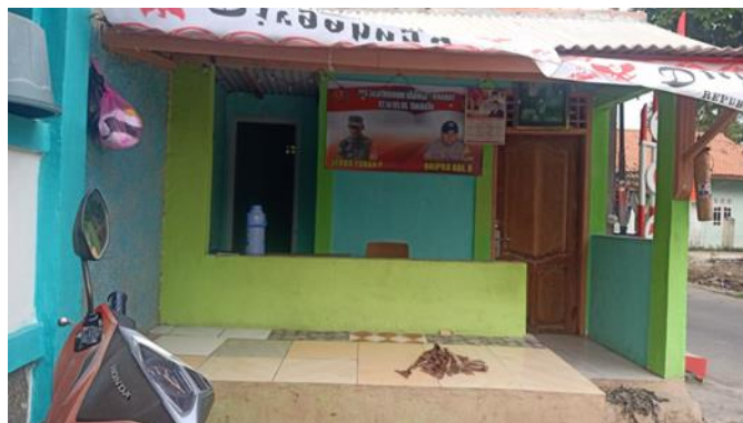
Gambar 3.13 Pos Keamanan Desa Tanjakan