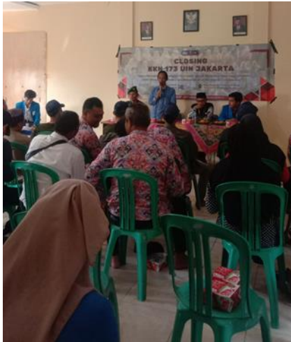
Gambar 3.5 Aula Kantor Desa di Lantai 2