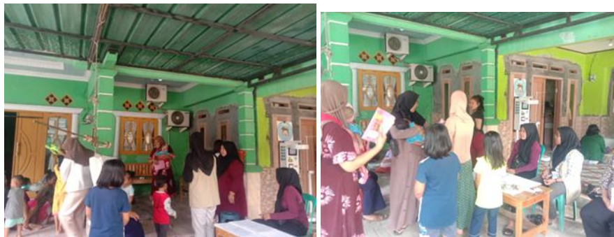
Gambar 3.6 Posyandu Desa Tanjakan

Sarana dan Prasarana kesehatan yang dimiliki Desa Tanjakan yaitu terdapat PosKesDes dan Posyandu sebanyak 5 buah. Kesehatan di Desa Tanjakan didukung dengan adanya bidan praktek, dokter, dan apotek. Sarana dan Prasarana di Desa Tanjakan sudah bisa dikatakan sangat baik karena posyandu di Desa Tanjakan selalu melakukan kegiatan imunisasi rutin, pemberian vitamin, pengukuran berat badan dan tinggi badan.