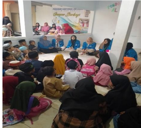
Mengajar Ngaji di Pondok Pesantren Al-Karimah