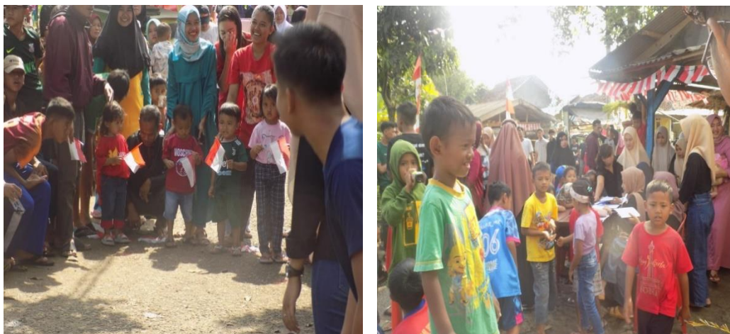
Gambar 4. 7: Kegiatan 17 Agustusan