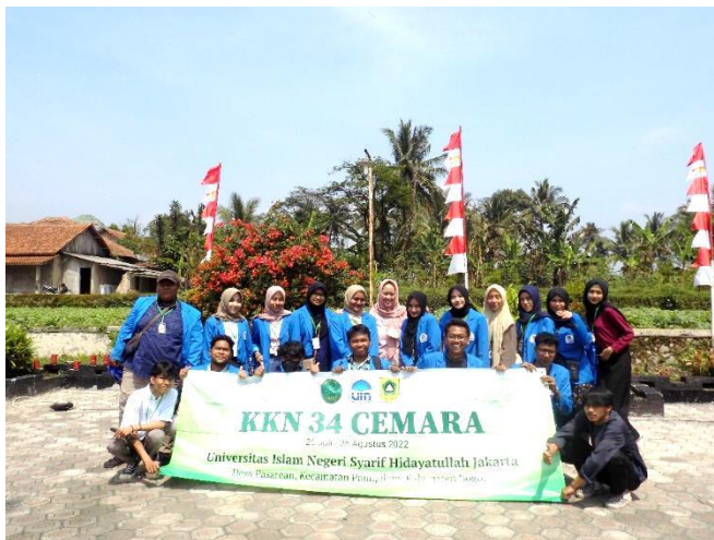
Closing KKN 034 CEMARA di Kantor Desa