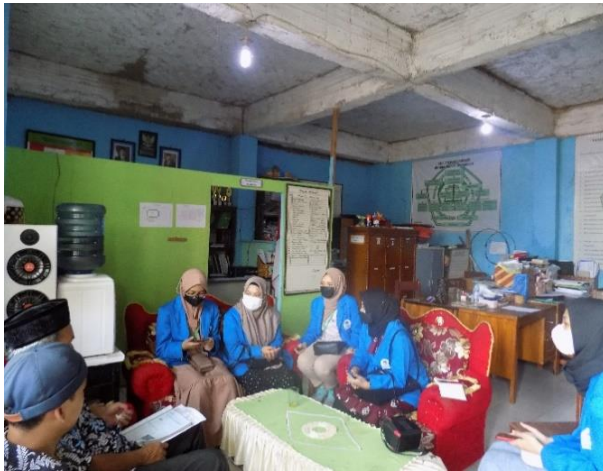
Sosialisasi dengan Kepala Sekolah di Yayasan Ibnu Hajar