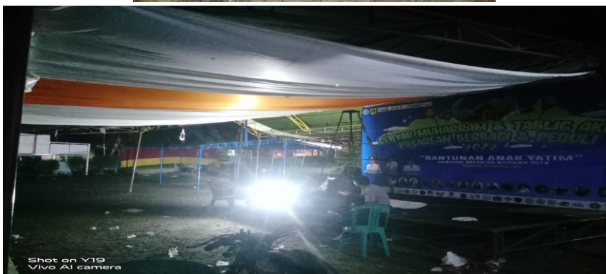
Gambar 4. 4: Kegiatan Muharram