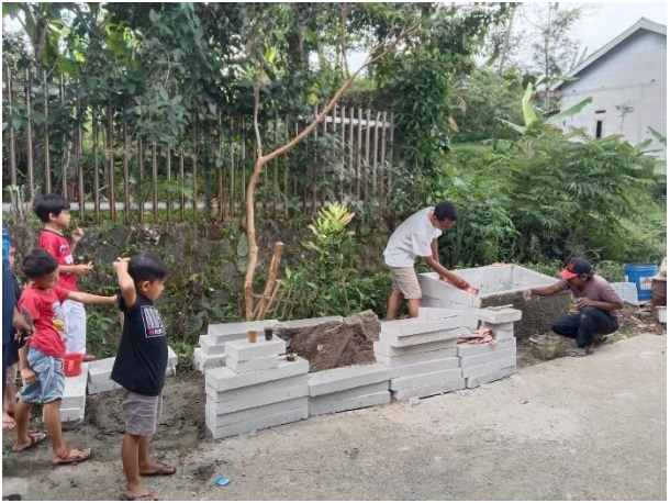
Pembuatan Bak Sampah