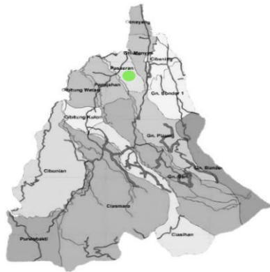
Gambar 3. 1: Letak Kelompok KKN 034

Berikut ini merupakan letak kelompok KKM-DR 034 yang dilaksanakan di Desa Pasarean, Kecamatan Pamijahan, Kota Bogor.