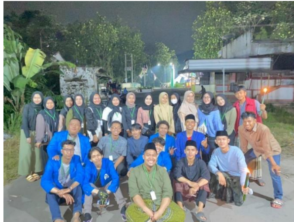
Pawai Obor Bersama sedesa Pasarean dalam rangka Memperingati Tahun Baru Islam 1444 H