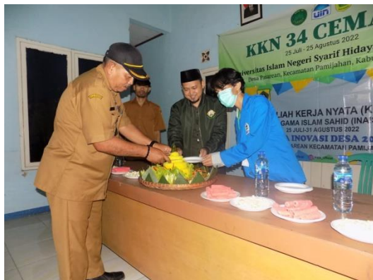
Opening Ceremony di Kantor Desa Pasarean, Kecamatan Pamijahan, Kabupaten Bogor