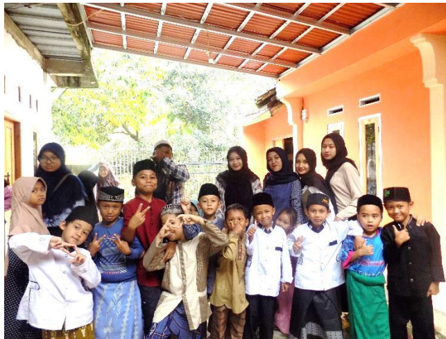
Mengadakan Taman Baca PonPes Al-karimiah