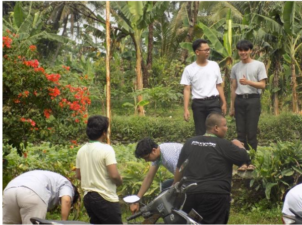
Gotong Royong Membersihkan Halaman Kantor Desa Pasca Opening Ceremony