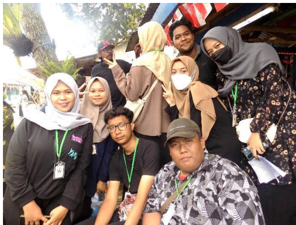
Kegiatan 17 Agustus di Kp. Hegarmanah