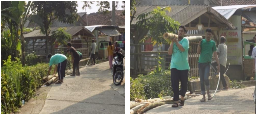
Gambar 4. 5 :Kegiatan Kerja Bakti