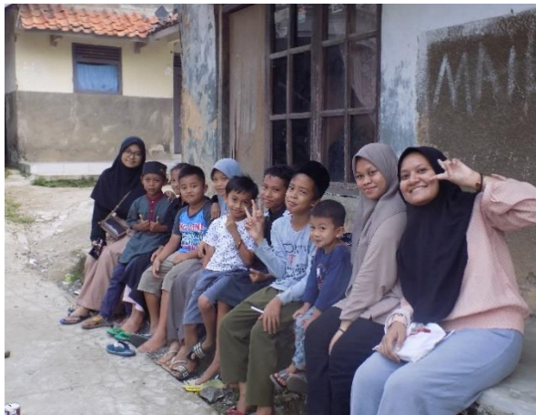
Main Bersama Anak-Anak Kp Babakan Empang