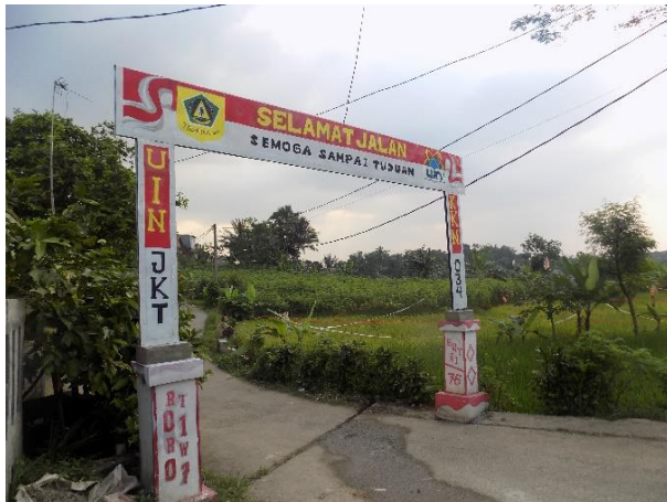
Pembuatan Gapura di Kampung Hegermanah