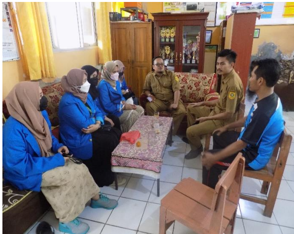
Sosialisasi dengan Kepala Sekolah di SDN Pasarean I Sosialisasi dengan Kepala Sekolah di SDN Pasarean II