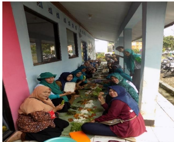
Makan Bersama Staf Perangkat Desa dan Ibu-Ibu Posyandu Pasca Opening Ceremony