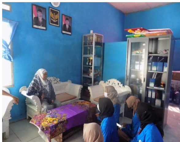
Sosialisasi dengan Kepala Sekolah di Yayasan Izzatul Madinah