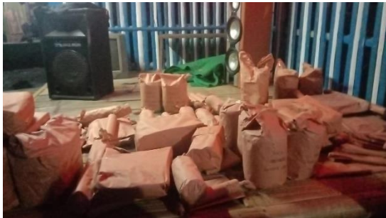
Pembagian Hadiah Lomba 17 Agustus