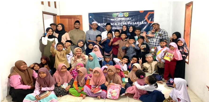
Gambar 4. 2: Kegiatan Taman Baca