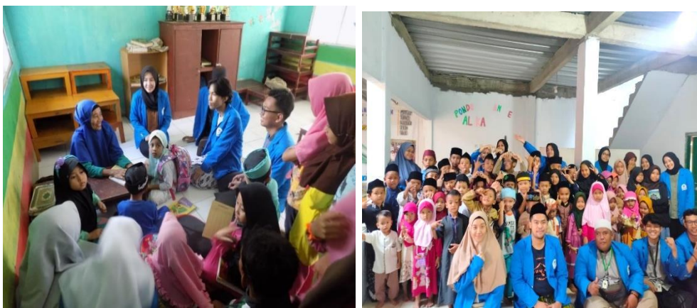
Gambar 4. 3: Kegiatan Mengajar Ngaji