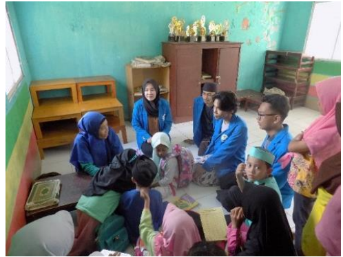
Pasca Mengajar TPQ di Kp Babakan Empang