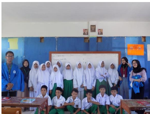
Gambar 4.1 : Kegiatan Belajar Mengajar di SDN Pasarean 01 & 02, MI Ibnu Hajar, dan SD-IT Izzatul Madani