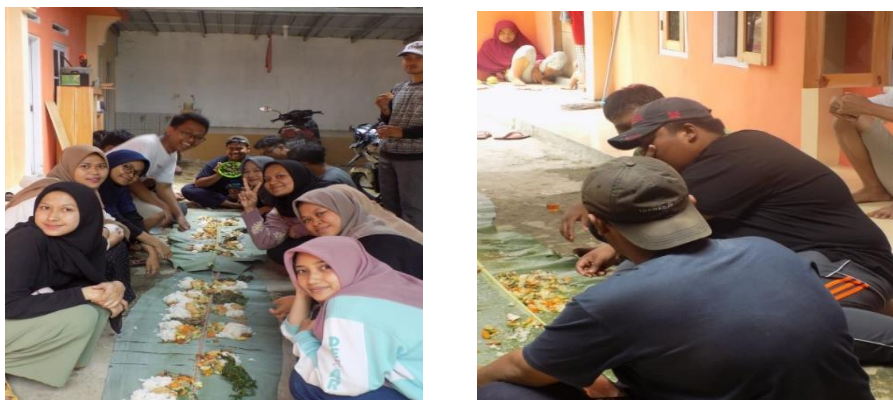
Gambar 4. 6 : Kegiatan Perpisahan (Ngaliwet)