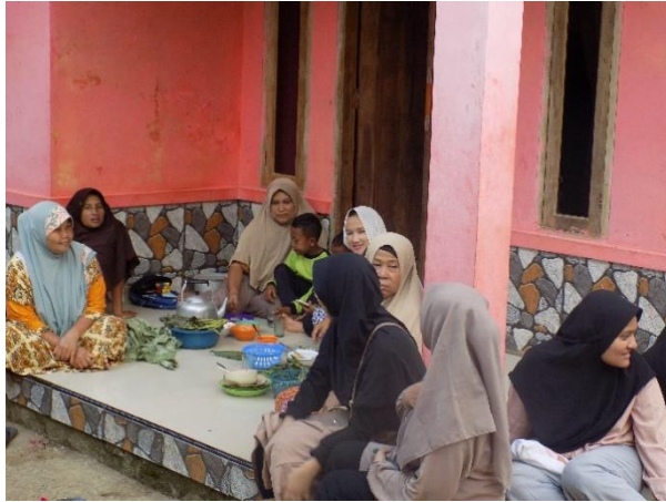
Makan Bersama Ibu-Ibu Kp Babakan Empang