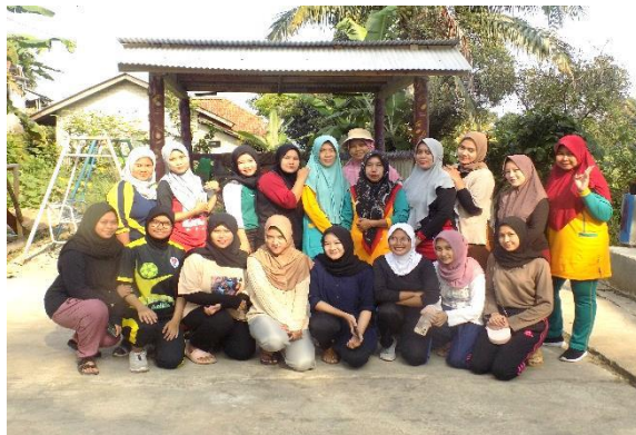
Senam Pagi Bersama ibu – ibu Desa Pasarean