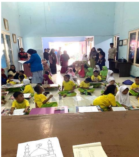
Kegiatan Lomba Muharram