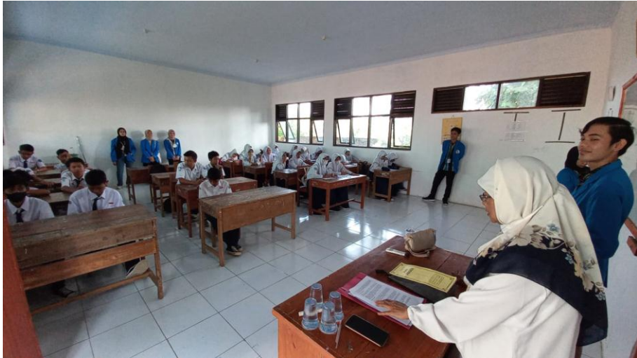
Gambar 4 : SMPN 1 Cibadak (Sarana dan Prasarana Desa Pasarkeong)