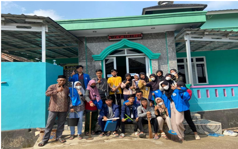
Gambar 9 : Musholla RW 02 Desa Pasarkeong (Sarana dan Prasarana Desa Pasarkeong)