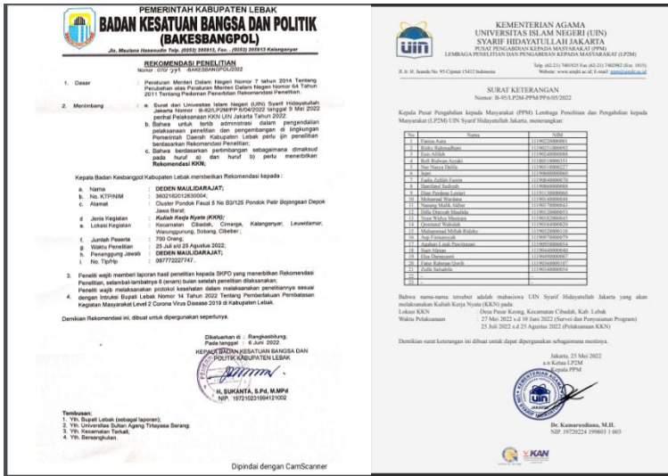
Gambar 10 : Arsip Surat KKN-PpMM I66