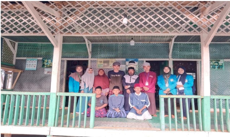
Gambar 7 : TPA Bani Anwar (Sarana dan Prasarana Desa Pasarkeong)