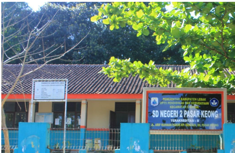
Gambar 3 : SDN 2 Pasarkeong (Sarana dan Prasarana Desa Pasarkeong)