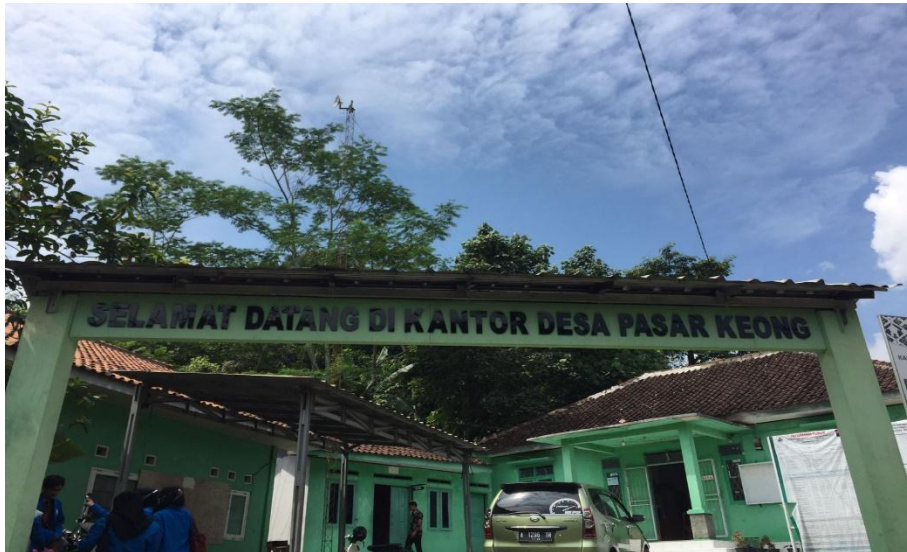
Gambar 2 : Kantor Desa Pasarkeong (Sarana Prasarana Desa Pasarkeong)