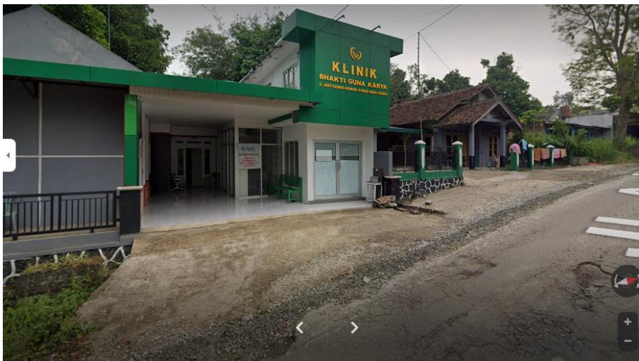
Gambar 5 : Klinik Bhakti Guna Karya (Sarana dan Prasarana Desa Pasarkeong)