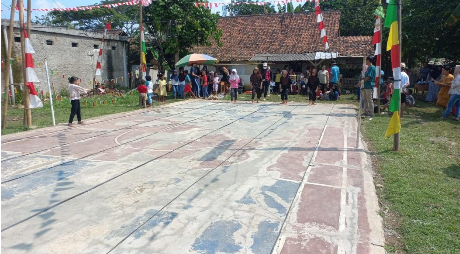
Gambar 6 : Lapangan Badminton RT 01 RT 02 Desa Pasarkeong (Sarana dan Prasarana Desa Pasarkeong)