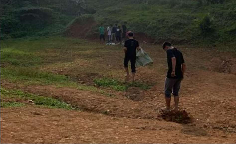
Gambar 8 : Lapangan Bola RW 02 RT 02 Desa Pasarkeong (Sarana dan Prasarana Desa Pasarkeong)