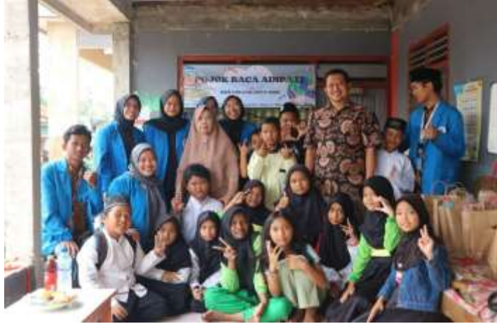
Gambar 1 Peresmian Pojok Baca Adipati

Berdasarkan gambar tersebut, tempat yang diresmikan menjadi Pojok Baca Adipati yakni kediaman Ibu Hj. Omi yang juga merupakan tempat pengajian anak-anak sekitar. Adapun hal yang mendasari program pojok baca yakni untuk membantu anak-anak sekitar dalam meningkatkan minat dan kemampuan membaca mereka. Selain itu, juga mengajak anak-anak sekitar agar mengurangi penggunaan gadget dengan lebih sering membaca