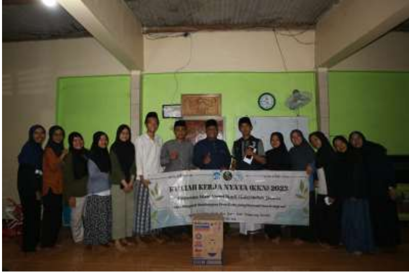
Gambar 2 Program Wakaf Qur'an Beserta Alat Pendukung

Berdasarkan gambar diatas, KKN 116 Adipati juga menyalurkan 2 buah dispenser ke TPA Annur dan Musholla Al-Kautsar. Adapun hal yang mendasari program wakaf qur'an beserta alat pendukung yakni karena masyarakat desa Kadu terbiasa dalam mengadakan pengajian rutin seperti pengajian kitab, pengajian zikir, pengajian anak-anak TPA tetapi masih terdapat kekurangan dalam fasilitas pendukung.