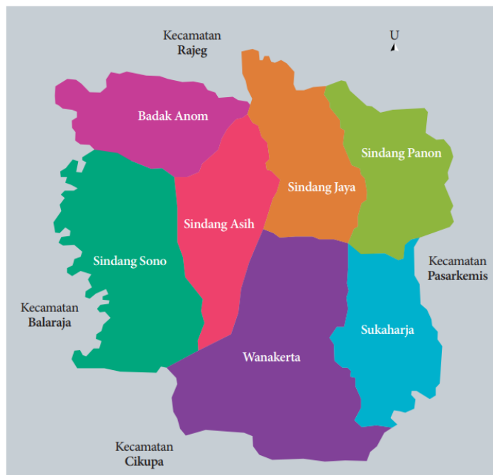
Gambar 3 I: Peta Wilayah Desa Sindang Jaya