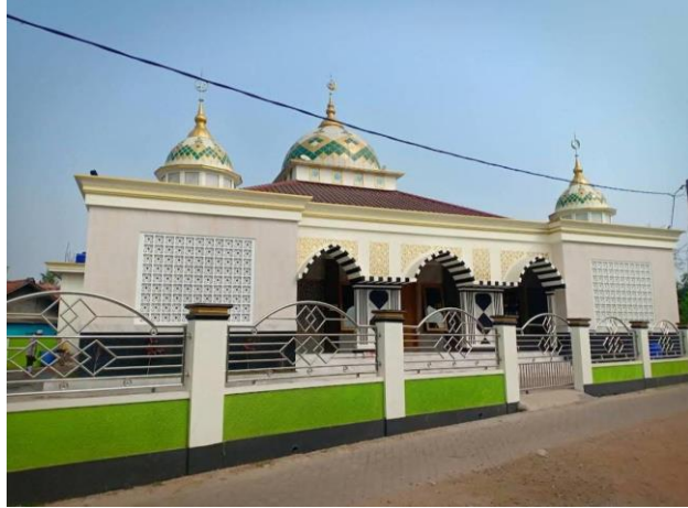
Gambar 3. 9: Masjid Al Falahiyah