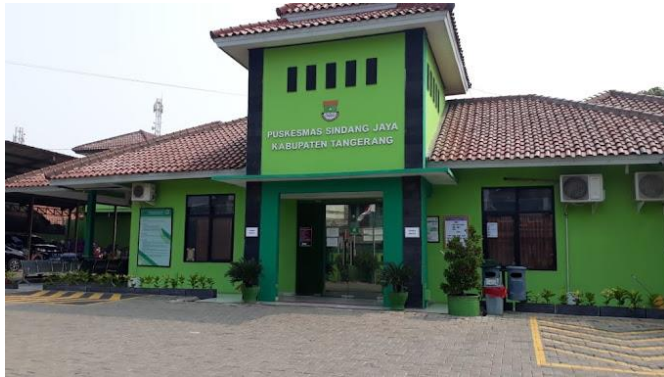
Gambar 3. 4: Puskesmas Kecamatan Sindang Jaya