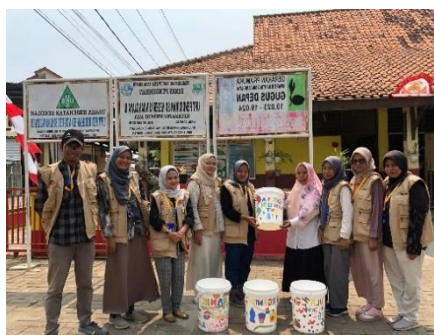
Gambar 4. 16: Kegiatan Pengadaan Tempat Sampah