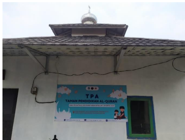
Gambar 3. 3: TPA Nurul Iman