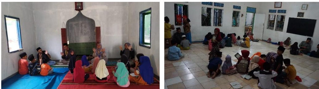
Gambar 4. 13: Kegiatan Mengajar Di TPA