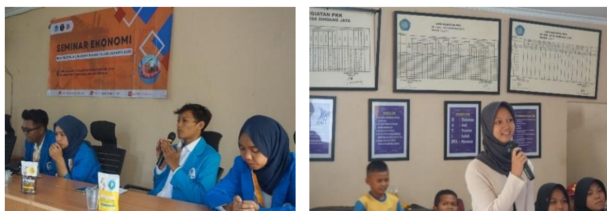
Gambar 4. 17: Kegiatan Seminar Ekonomi