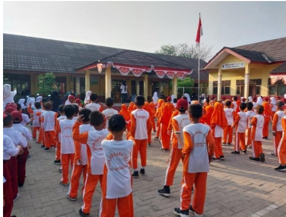
Gambar 3. 7: SDN Sindang Jaya 3