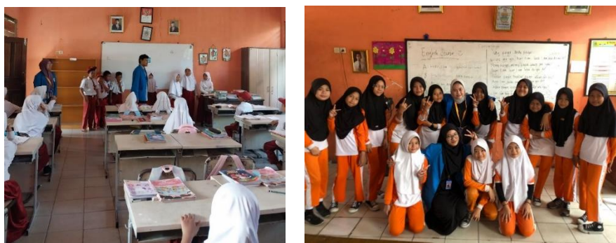
Gambar 4. 3: Kegiatan Mengajar Sekolah Dasar