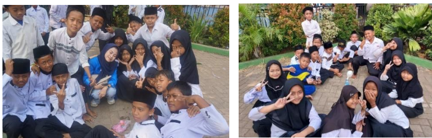
Gambar 4. 4: Kegiatan Fun Science