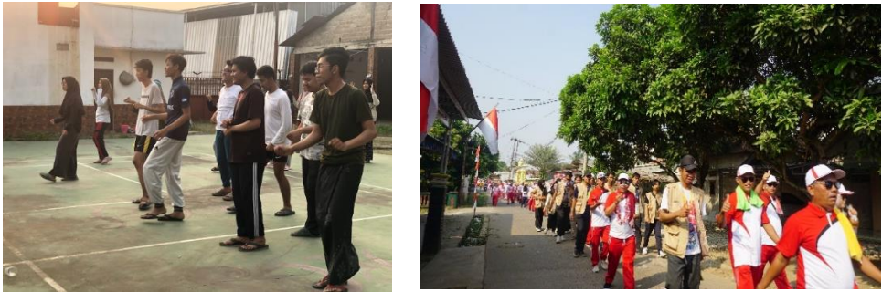
Gambar 4. 8: Kegiatan SATULA Sehat