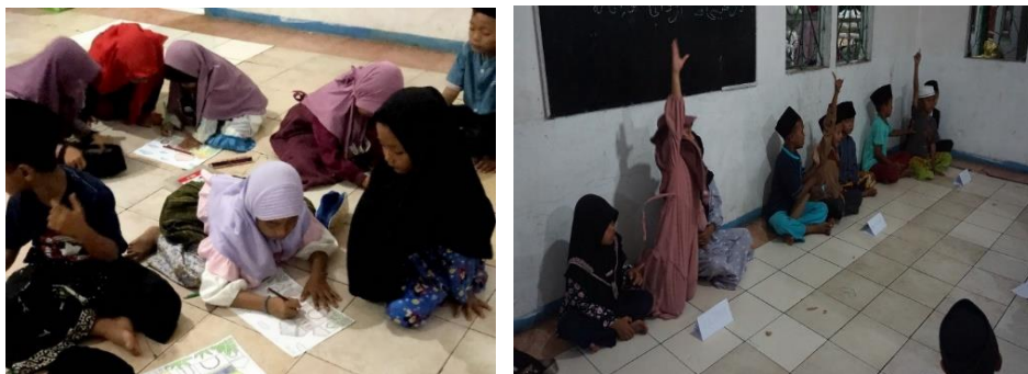
Gambar 4. 2: Kegiatan Lomba Islami