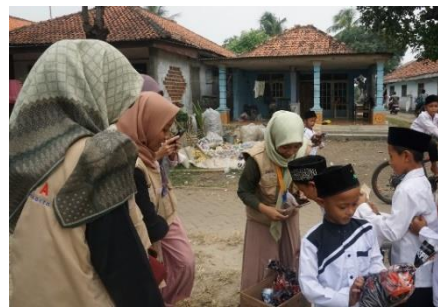
Gambar 4. 7: Kegiatan SATULA Berbagi