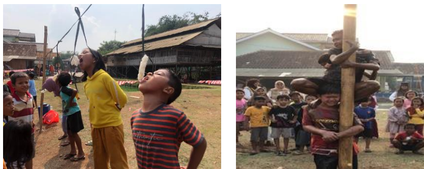
Gambar 4. 10: Kegiatan Lomba HUT RI