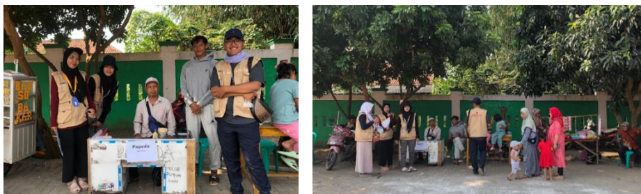
Gambar 4. 18: Kegiatan Bazar UMKM