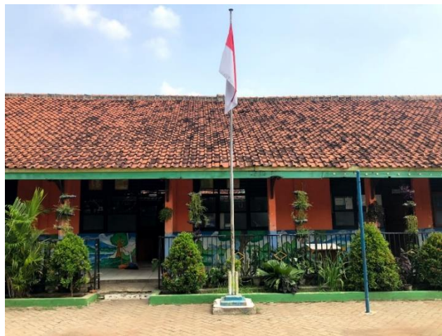
Gambar 3. 5: SDN Sindang Jaya 1