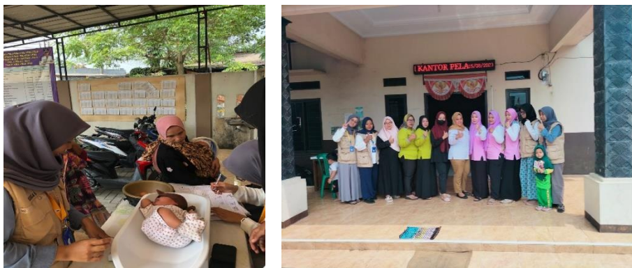
Gambar 4. 12: Kegiatan Posyandu bersama Ibu PKK Desa Sindang Jaya