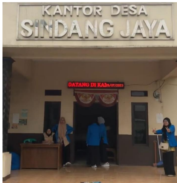
Gambar 3. 2: Kantor Desa Sindang Jaya