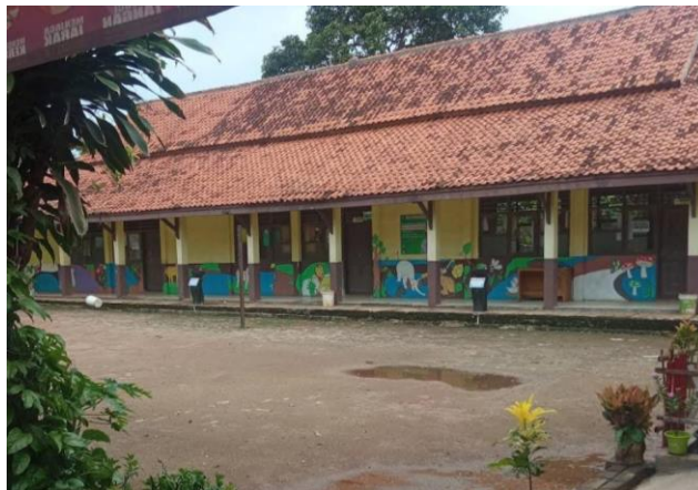
Gambar 3. 8: SDN Sindang Jaya 4