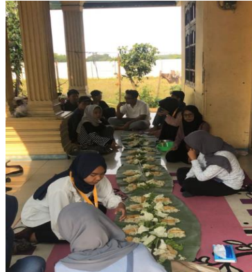
Gambar 4. 9: Kegiatan SATULA Bertamu