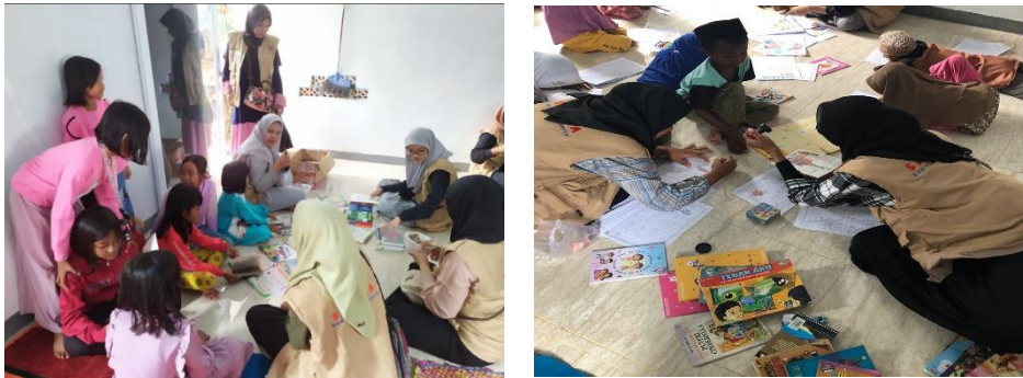
Gambar 4. 14: Kegiatan Pojok Baca