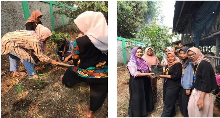
Gambar 4. 15: Kegiatan TOGA