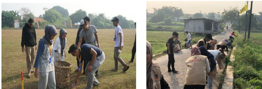
Gambar 4. 6: Kegiatan Kerja Bakti