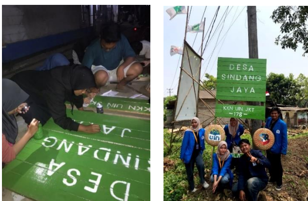
Gambar 4. 11: Kegiatan Membuat Plang Jalan Desa Sindang Jaya