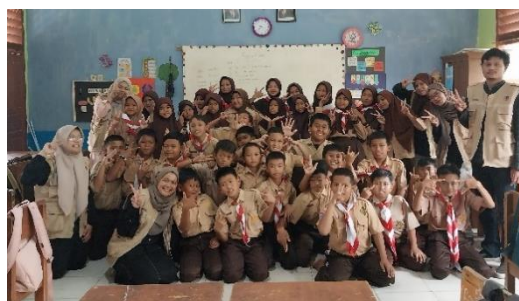
Gambar 4. 5: Kegiatan English Course