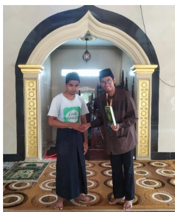
Gambar 4. 1: Kegiatan Memakmurkan Masjid