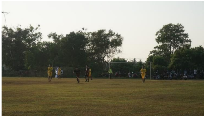
Gambar 3. 10: Lapangan Dampit